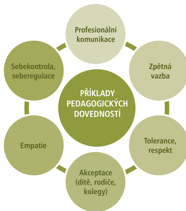
Obrázek 2: Příklad profesních kompetencí pedagoga